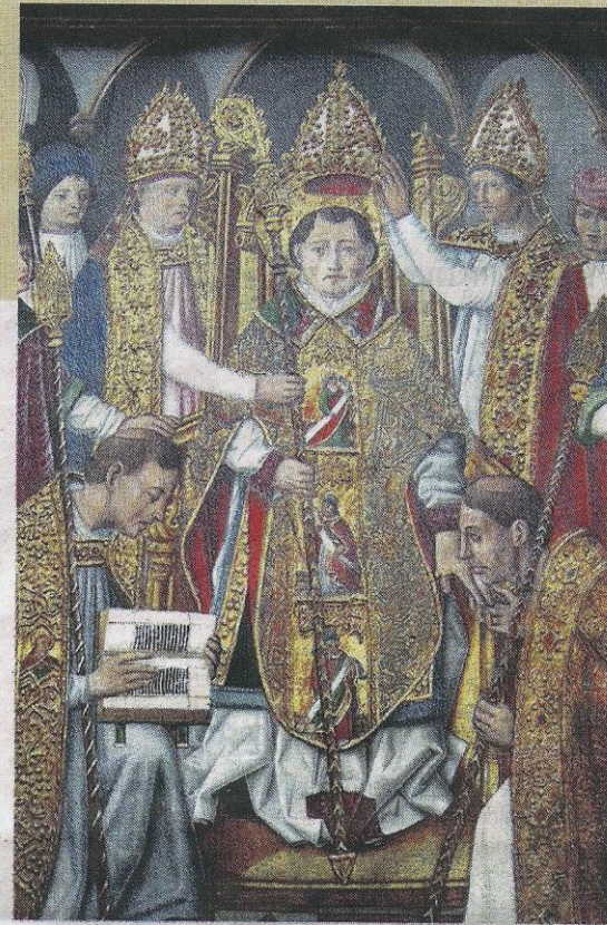
La obra de San Martín, de Lascuarre, está en Nueva York. AN

tenidos del libro que publica con recursos propios por falta de ayudas.