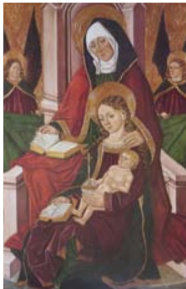
Santa Ana, Virgen y Niño, de Sijena. N.M.