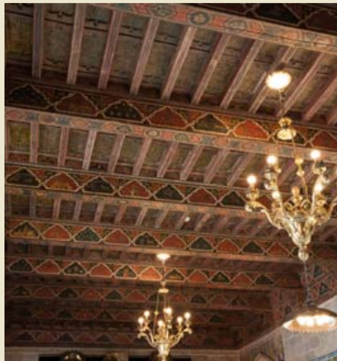
Artesonado procedente de Barbastro y ubicado en California. A.N.

Según la nota sacada de la ficha de recepción, las medidas con de 4,87 x 10,97 metros. "Al parecer -recuerda- se construía el volumen donde se acomodaría la Sala de Billar a la que se destinó la techumbre procedente de Barbastro. Los conservadores me informaron de que la Sala se adaptó a las medidas del techo". La iconografía se basa en temas de caza y de tauromaquia, entre otros