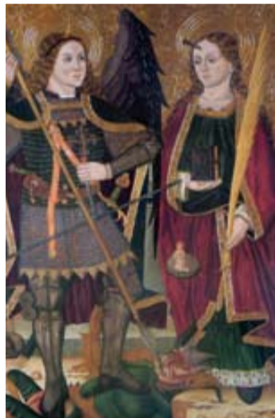
San Miguel y Santa Engracia, de Marcén. A.N.

señala-, es posible conocer las que están en colecciones particulares".