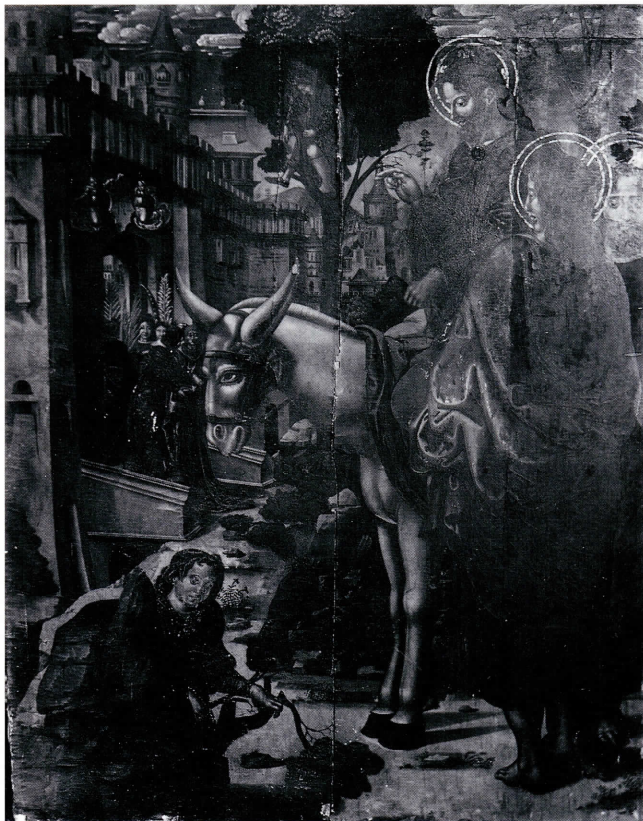
Entrada en Jerusalén.