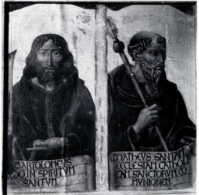
San Bartolomé y San Mateo.