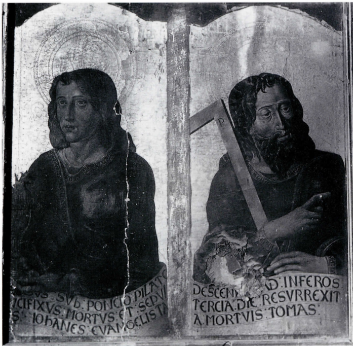
San Juan y Santo Tomás.

paternidad del retablo mayor: «la promiscuidad gótico renacentista, típica de Forment anterior al 1520, el objetivismo poco fantasioso, la preferencia por las actitudes naturalistas desprovistas del sentimiento patético, y sus formas poco movidas, coinciden con estas pinturas frecuentemente» (Soldevila Faro, op. cit. ).