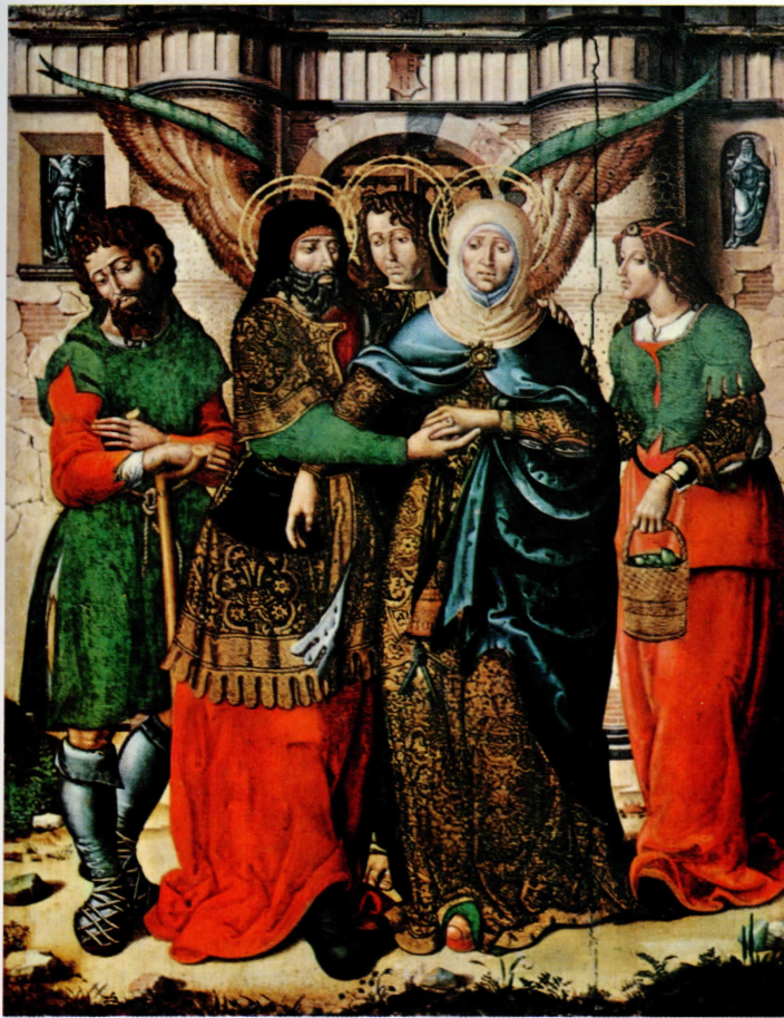
El abrazo en la puerta dorada.