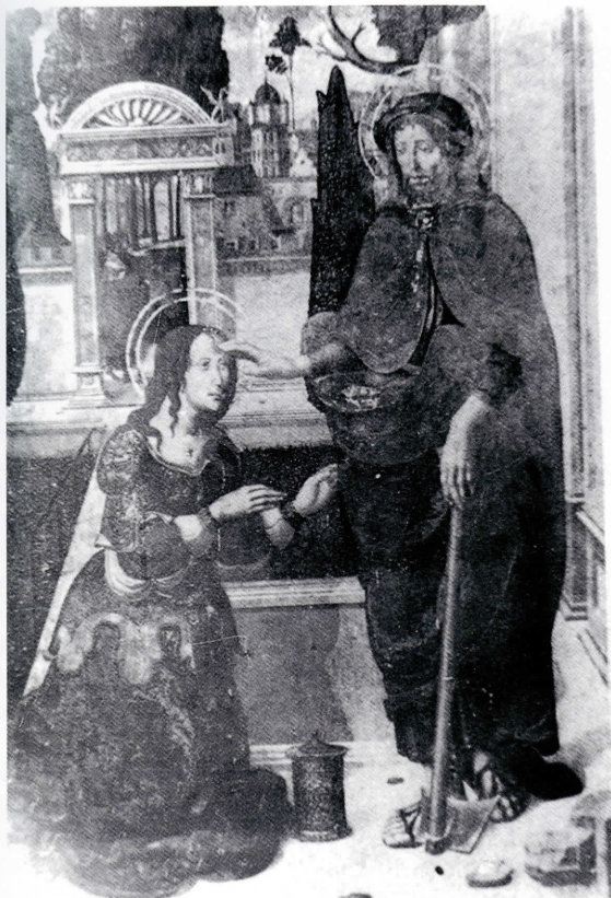
Noli me tangere.