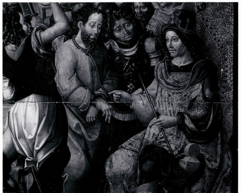
Cristo ante Pilatos.

siglo XVIII. En el coronamiento del retablo del XVI habría un Calvario, también desaparecido. En las enumeraciones de obras de arte que hubo en Sigena no consta que hasta la guerra civil se conservara ninguna talla de la que pueda sospecharse que procediera del centro del retablo, a no ser que en él estuviera la imagen románico-gótica que se conservó en un retablo lateral del coro y que se vinculaba a la fundación del Monasterio (R. del Arco Garay: Catálogo Monumental de España: Huesca , Madrid, 1942, p. 403).