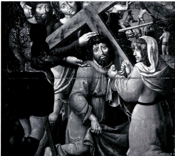
Cristo con la cruz a cuestas.