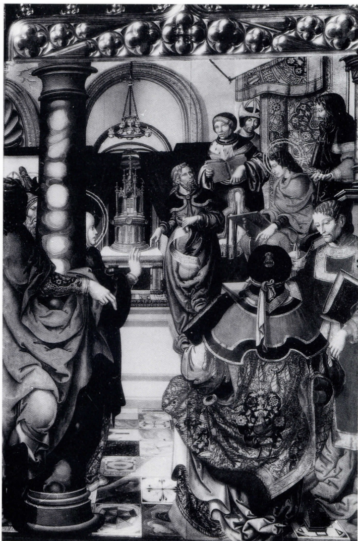
Jesús entre los doctores.

predela. También de ella habla Post que incluyó la foto de la colección Mora. Junto con esta tabla cita una «Entrada en Jerusalem» que también estuvo en Albelda (Ch. R. Post, ibidem , p. 131). Tampoco conocemos las medidas de esta tabla, pero indudablemente es del mismo conjunto que la anterior, y por lo tanto también pudo haber formado parte de la predela.