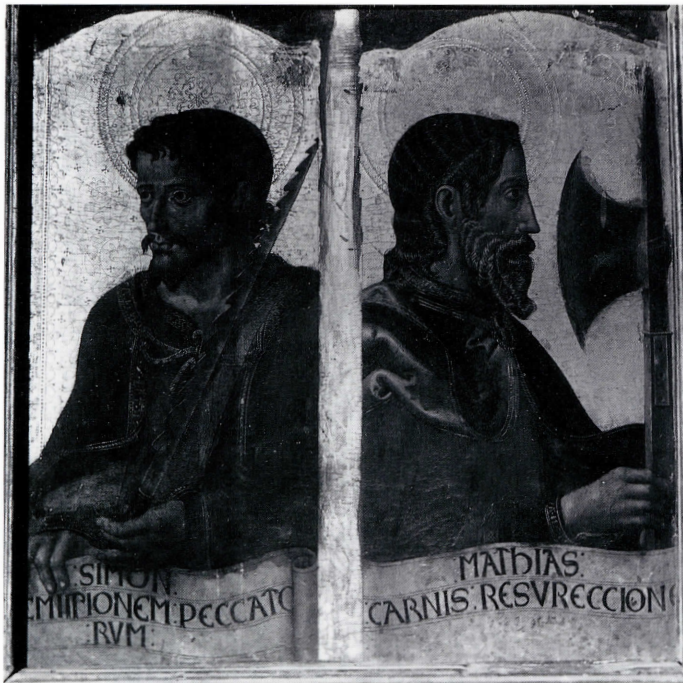
San Simón y San Matías.