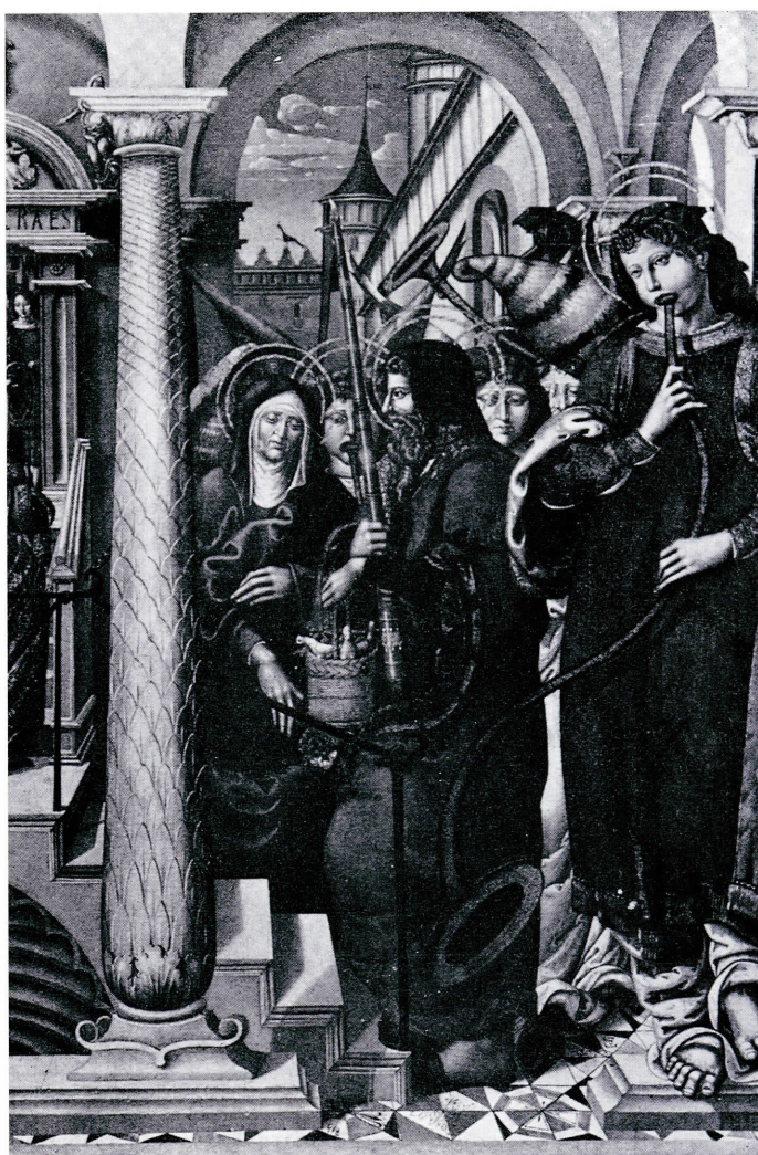
Presentación de la Virgen en el Templo.

En el catálogo del Museo Provincial de Bellas Artes de Zaragoza figuran como procedentes del