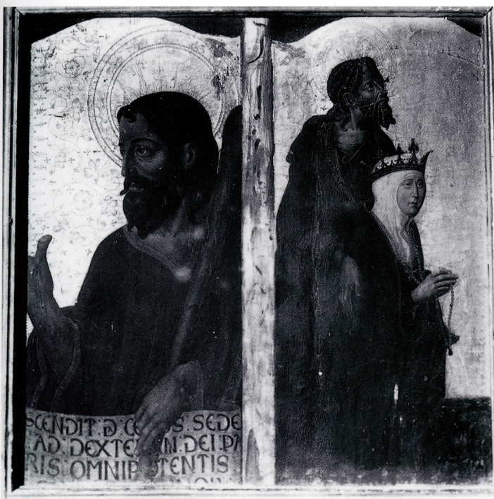
¿Judas Tadeo y donante?